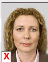
B. Déformation optique