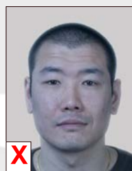
C. Rendu non naturel