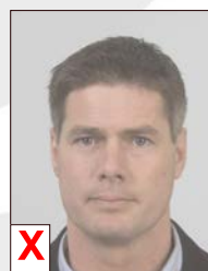
D. Contraste insuffisant