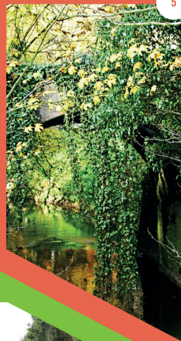
La Thines

FLORE • Chêne, bouleau, frêne, hêtre, jacinthe des bois • Végétation nitrophile comme la reine des prés