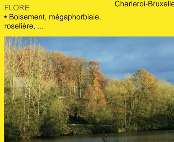
La réserve naturelle

Situé à la frontière de Bornival, ce lieu protégé depuis 1988 s'étend le long du Canal Charleroi-Bruxelles.