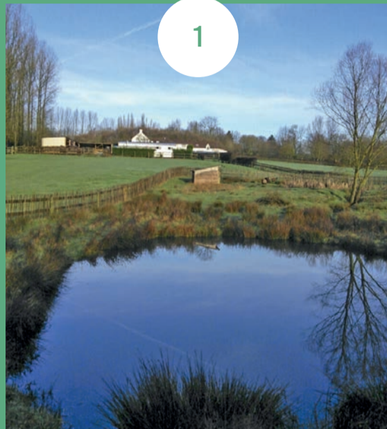
Les étangs

FLORE • Peupleraie avec en sous-étage des reliques de saules têtards • Orchidée épipactis à larges feuilles (espèce protégée)