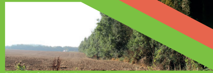
Pré humide

FLORE • Peupleraie • Épilobe hirsute, angélique des Bois, menthe aquatique, valériane officinale