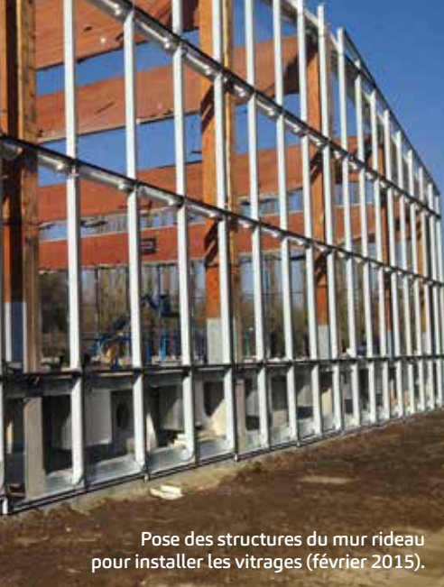
Pose des structures du mur rideau pour installer les vitrages (février 2015).