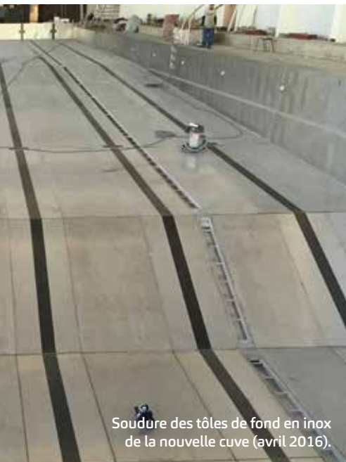
Soudure des tôles de fond en inox de la nouvelle cuve (avril 2016).