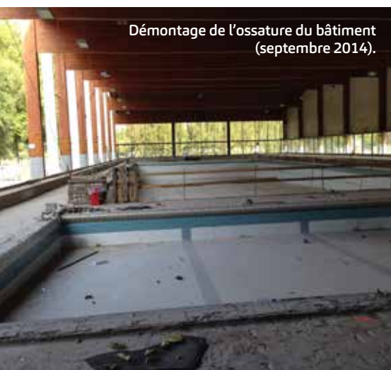
Démontage de l'ossature du bâtiment (septembre 2014).

Avec toutes ces baies vitrées, on a l'impression de nager dans le cadre verdoyant du parc de la Dodaine.