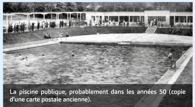
La piscine publique, probablement dans les années 50 (copie d'une carte postale ancienne).

Le parc de la Dodaine est aménagé dès 1811 en promenade publique par le maire Jean-Baptiste Dangonau. Plusieurs pièces d'eau font le bonheur des petits et des grands. Le jardin de fleurs avec son kiosque est créé vers 1855 par l'architecte Raymond Carlier. Sur les bords du grand étang, dit de canotage, une partie est réservée à la baignade et une plage est aménagée.