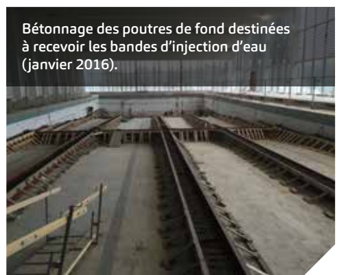
Bétonnage des poutres de fond destinées à recevoir les bandes d'injection d'eau (janvier 2016).

La sécurité des nageurs est assurée par un système automatique anti-noyade, appelé « Poséidon ». Nivelles est la seule à en posséder un en Brabant wallon !