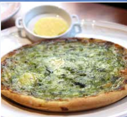
Remise des labels Djote | 5

120 ÈME CARNAVAL DE NIVELLES DU 17 AU 20 FÉVRIER