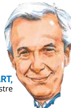
■ Pierre HUART, Bourgmestre