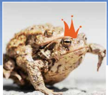
Opération Batraciens | 6