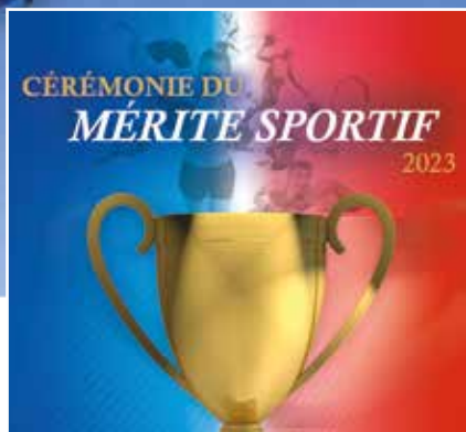
Les résultats | 5