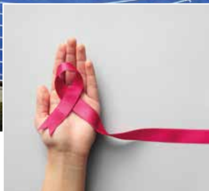
Octobre rose | 6