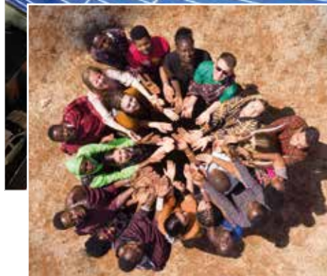
Mois de la Solidarité internationale | 5