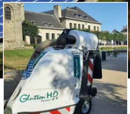
Marathon de la Propreté | 7