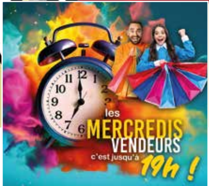
Les Mercredis vendeurs jusqu'à 19h | 5