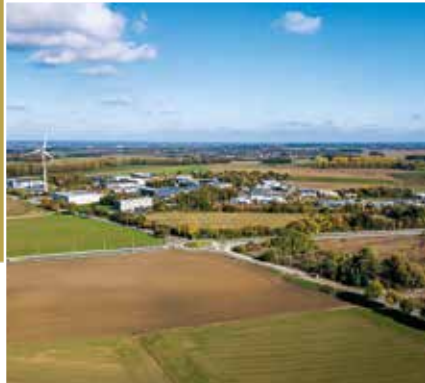
Royal Photo-Club Entre Nous - 90 ans | 4