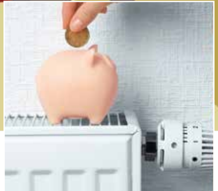
Réduire vos factures d'énergie | 7