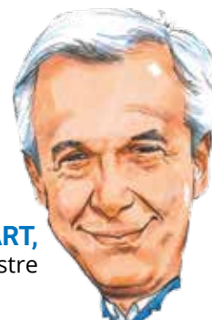
■ Pierre HUART , Bourgmestre