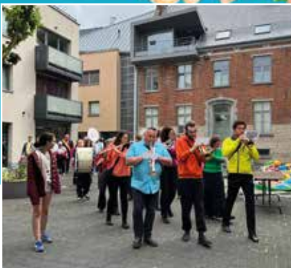
Braderie de l'Ascension | 4