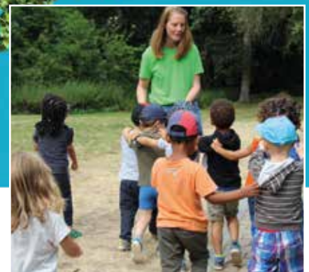
Plaine de vacances communale | 5