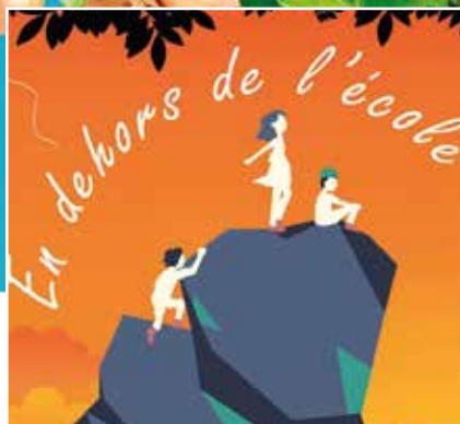
Salon ATL / Petite enfance | 5