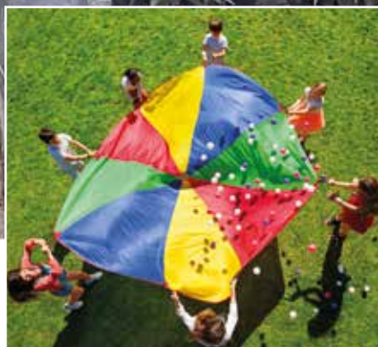
Interquartiers et Villages ! | 4