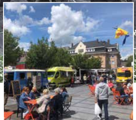
Nivelles Village | 5