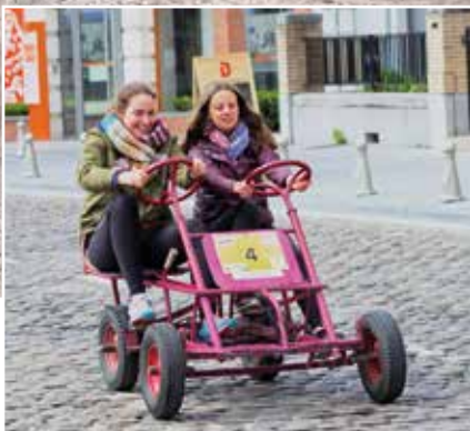
6h Cui-tax | 4