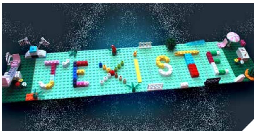
© Création de montage Gabin JACQUEL

Dans le cadre de la Journée Internationale des Droits de l'Enfant, les Échevins de la Jeunesse et de la Solidarité internationale, des Droits humains et de l'inclusion, en collaboration avec le Centre culturel, vous invitent à une série d'activités gratuites pour les plus jeunes et leur famille.