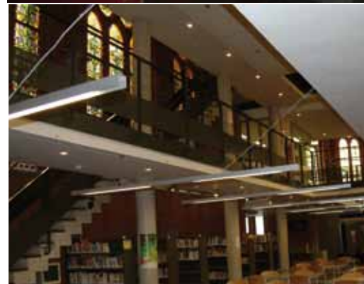
© A. C et C. V.